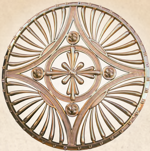
KRB 01 Rozeta (ozdobna wentylacja), odlew ażurowy Ø 100 cm