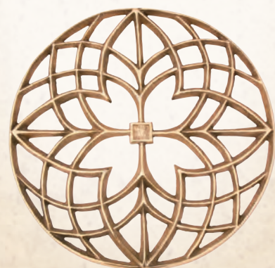
KRB 04 Rozeta (ozdobna wentylacja) Ø 30 cm, Ø 50 cm, Ø 60 cm,