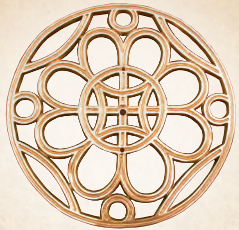
KRB 02 Rozeta (ozdobna wentylacja) Ø 55 cm