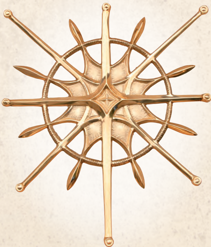
KRB 03 Rozeta ozdobna Ø 45 cm